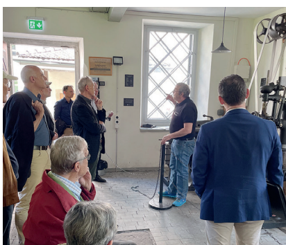
Abb. 5: Die Nutzung der Wasserkraft.

Noch heute präsentiert sich diese Einheit von Arbeitsstätten, Lager- und Ökonomiegebäuden, Wasserkraftanlagen, Kosthäusern und dem Fabrikantenwohnhaus mit seinen Parkanlagen als wunderbar erhaltene Einheit. Das Areal wird zudem eindrücklich vom Viadukt der früheren «Uerikon-Bauma-Bahn» überspannt und ist Ausgangspunkt für Wanderungen auf den abenteuerlich gebauten, romantischen Guyer-Zeller-Wanderwegen.