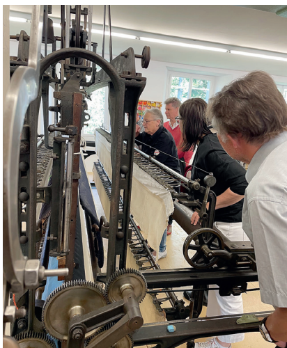
Abb. 4: Die Faszination des Stickens.