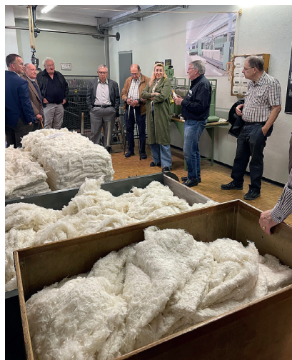
Abb. 2: Erläuterungen im Spinnerei-Vorwerk.

Garnherstellung praxisnah gezeigt (Abb. 2). Die Maschinen beeindruckten durch ihre Funktionstüchtigkeit, die älteste davon ist über 150 Jahre alt.