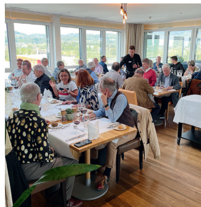
Abb. 8: Das gemeinsame Nachtessen mit Spezialitäten aus der Region.

So können wir in diesem Jahr auf eine ausserordentlich gelungene Generalversammlung zurückblicken, die uns sicherlich lange in Erinnerung bleiben wird. Am klaren Himmel war der beginnende Vollmond zu sehen und leuchtete den Teilnehmenden auf dem Weg nach Hause. ■